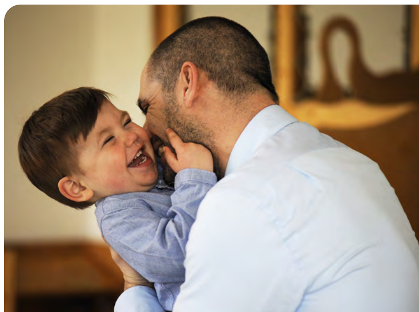
Foto © 2013 Constanze Wild, aus der Wanderausstellung „FamilienSinn“

Für Mütter mit Babys von der 6. Lebenswoche bis zum ersten Jahr. Die Babys können mit allen Sinnen in altersgerechter Umgebung spielen, sich bewegen und haben Kontakt mit Gleichaltrigen. Die Mütter lernen, die Bedürfnisse ihres Babys zu beobachten und zu erkennen, können sich regelmäßig mit anderen Alleinerziehenden treffen und über die Entwicklung und Erziehung ihrer Babys und ihre Lebenssituation austauschen.