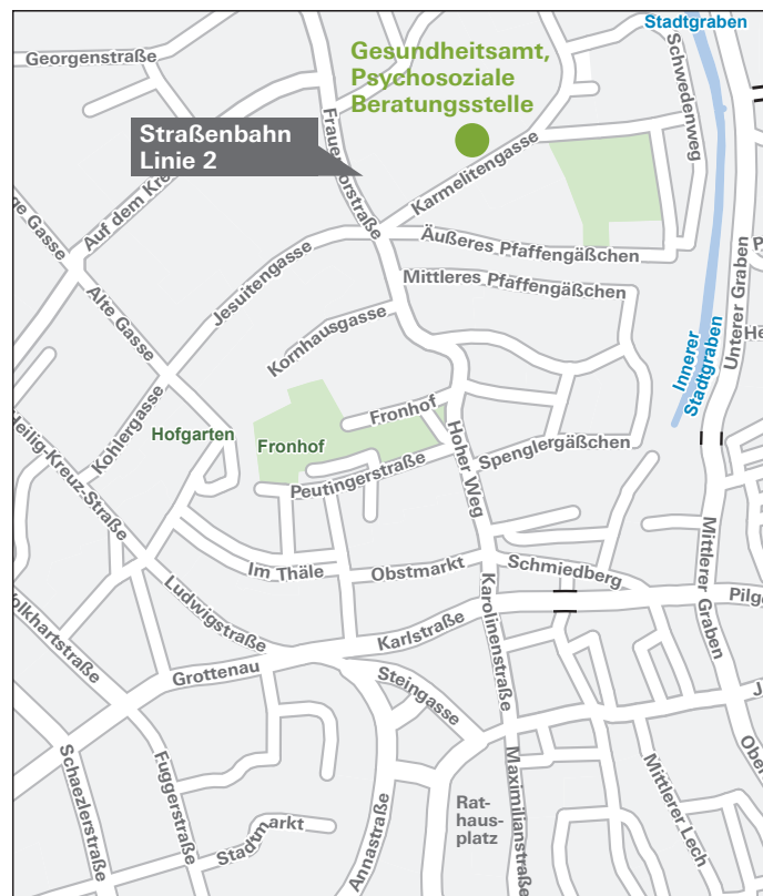
Kartengrundlage: Stadt Augsburg, Geodatenamt; Geobasisdaten: Bayerische Vermessungsverwaltung

Augsburg Königsplatz Bahnsteig B2, Straßenbahn Linie 2 Richtung Augsburg West P+R bis Haltestelle Augsburg Mozarthaus/Kolping