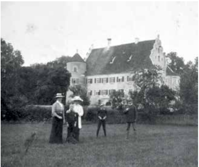
Die Familie von Süßkind vor Schloss Bächingen, 1913 (Foto: Privatbesitz).