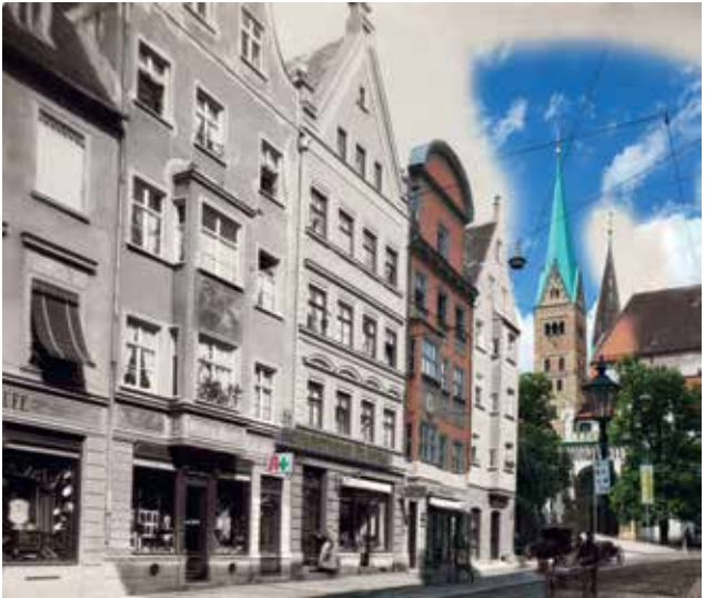
Hoher Weg mit Domkirche, ca. 1890/2024 (Fotomontage: Matthias Radochla).