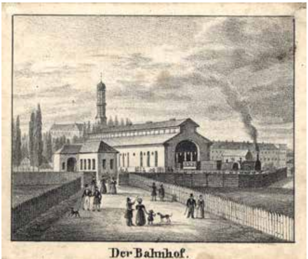
Augsburgs erstes Bahnhofsgebäude vor dem Roten Tor, eröffnet am 4. Oktober 1840.