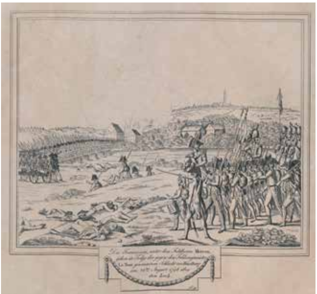
Französisches Heer in der Schlacht vor Friedberg, 24. August 1798 (SuStBA, Graph 17-12)