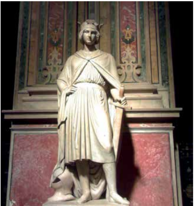
Grabdenkmal für König Konradin in S. Maria del Camine, Neapel. Nach einem Entwurf von Berthel Thorvaldsen.