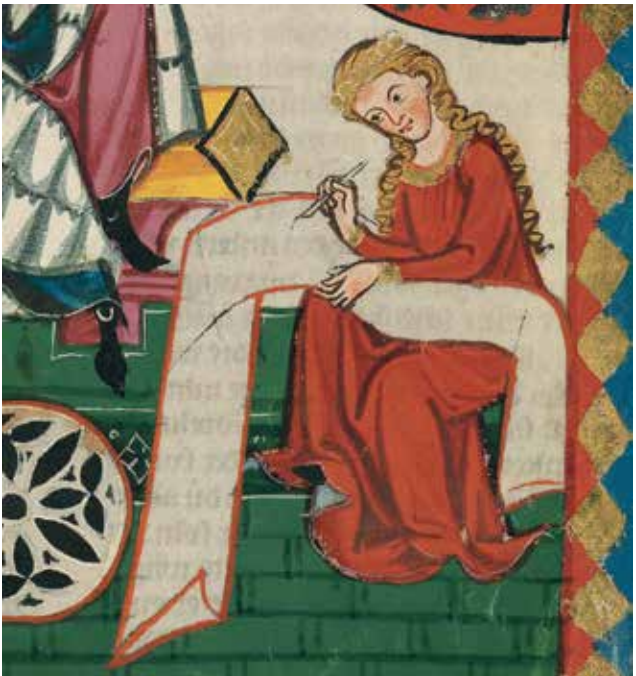
Darstellung einer Schreiberin in der Manessischen Liederhandschrift, ca. 1300/1340 (Universitätsbibliothek Heidelberg, Cod. Pal. germ. 848).