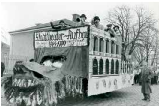
Satirischer Motivwagen des Augsburger Faschingsumzugs vom 24.2.1952 zur Verzögerung des Theater-Wiederaufbaus.