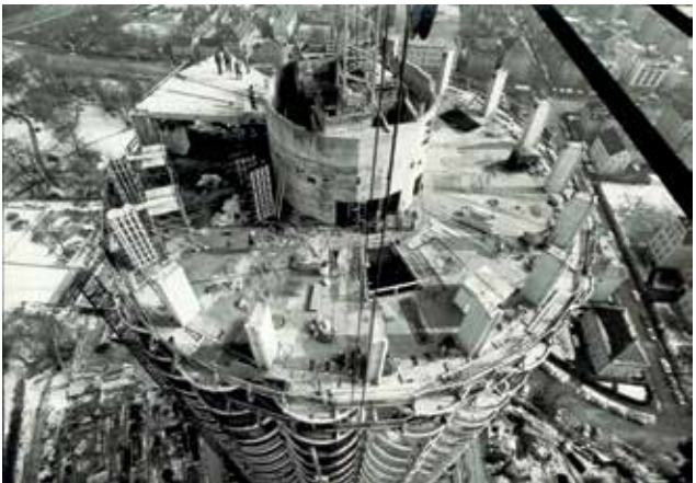
Luftbild aus der Bauphase des Hotelturms, 1971/72.