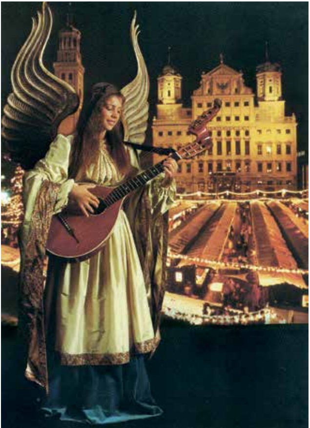
Postkarte zum Augsburger Engellespiel, 1970er Jahre.