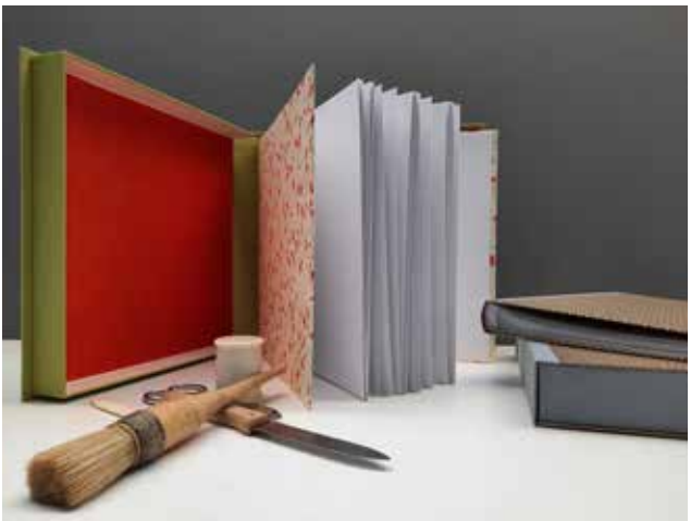
Materialien zur Gestaltung eines eigenen Sammelalbums.

Gestalten Sie unter fachlicher Anleitung ein Album für Fotos, Notizen oder Rezepte mit passender Aufbewah- rungskassette.