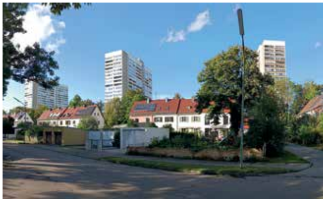
Blick auf den Gebäudekomplex des Schwabencenters