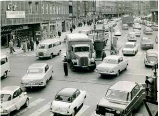
Verkehrinsel an der Karlstraße mit Blick Richtung Kennedy-Platz, ca. 1964.