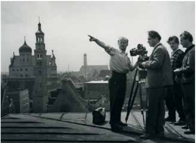
Kamerateam bei Aufnahmen zum Film – „Mozart reist durch das Schwabenland“, 1955.

Kostenlose Tickets sind im Stadtarchiv und in der Bürgerinfo am Rathausplatz erhältlich.