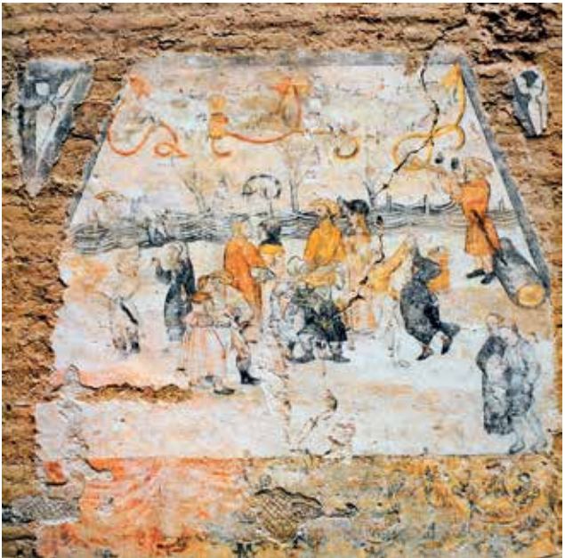
Bauerntanz-Fresko Ecke Grottenau 4 – Ludwigstraße 13, 1. Drittel des 16. Jhs. (Foto: Franz Kugelmann).