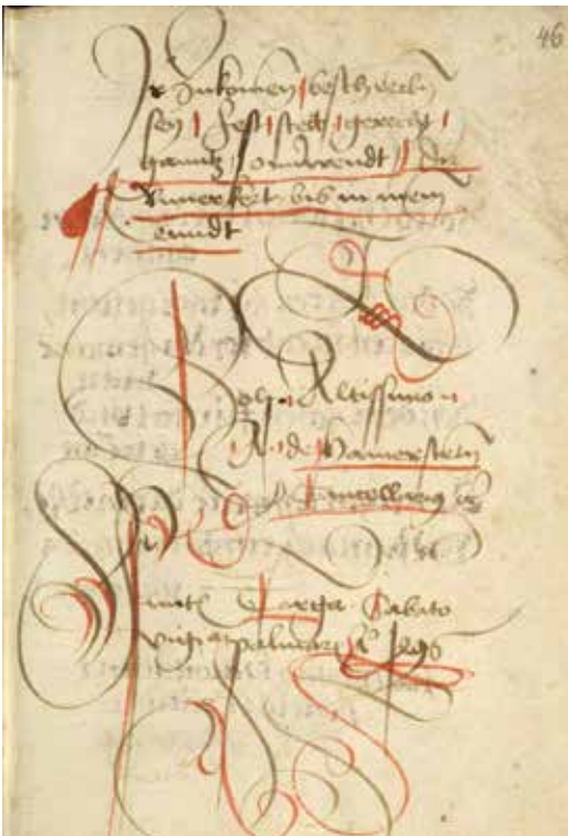
Seite aus der Dichtung „Hystori vom Hirsch mit dem goldenen Geweih“ (SLUB Dresden, Mscr. Dresd. M. 279).