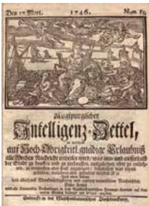
„Augsburgischer Intelligenz-Zettel“, Titelblatt, 1745.