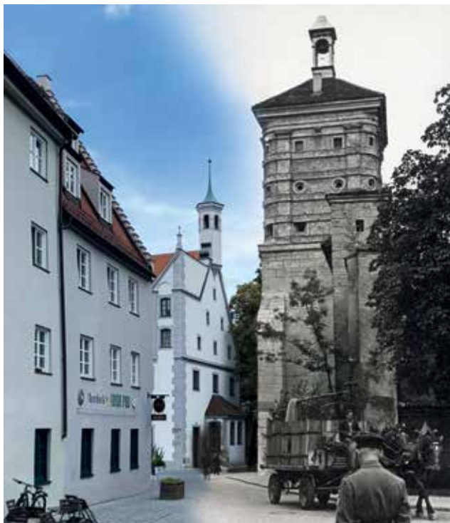
Rotes Tor 1943/2023.

Treffpunkt: Vor dem Roten Tor (Ecke Murdock's)