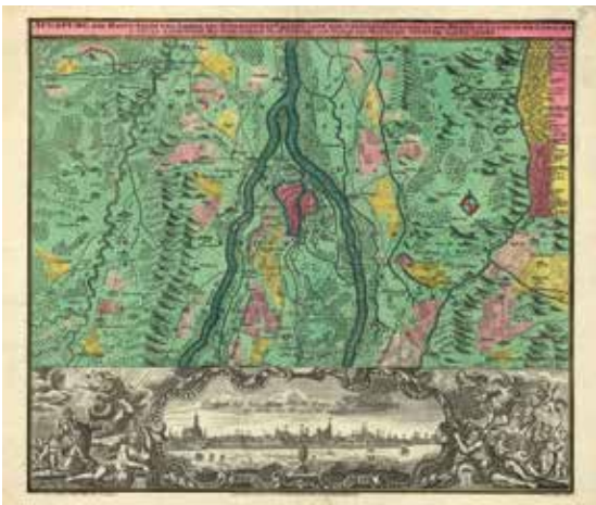
Augsburg als Hauptstadt und Zierde des umliegenden Kreises. Gedruckte Rahmenkarte von Gottfried Rogg/Mathäus Seutter, ca. 1758.

Begrenzte Plätze, Anmeldung erforderlich Unkostenbeitrag pro Person: 5,- Euro