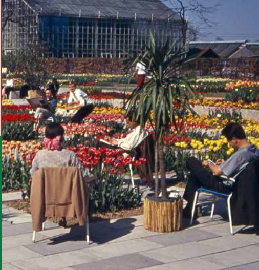
Tulpenblüte im Sengarten, ca. 1964