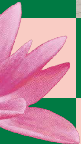
Blick auf das Viktoria- Regia-Becken, Postkarte von 1938 Verlag Robert Schadewitz