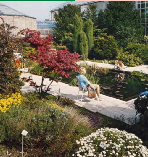
Blick auf den Alten Wassergarten, ca. 1970