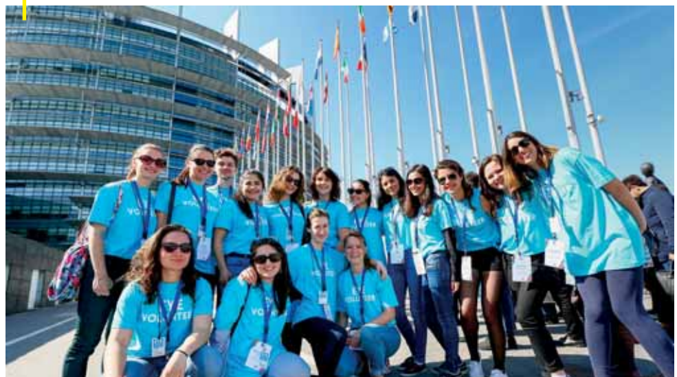
European Youth Event

https://www.europarl.europa.eu/european-youth-event/de/eye2020/home.html