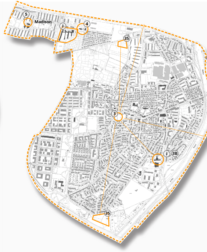
Soziale Infrastruktur für Jugendliche

○ Standorte von Schulen, SJR und Freiflächen Nummern siehe Bestandsaufnahme