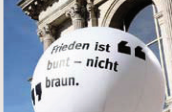
Heinz Paula, MdB Vorsitzender Bündnis für Menschenwürde e.V.