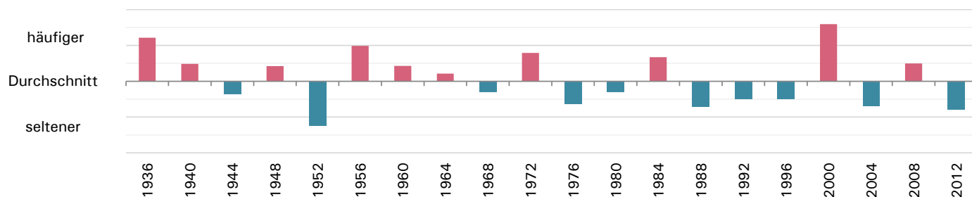
Abb. 1: Personen mit Geburtstag am 29. Februar im Verhältnis zu Personen des entsprechenden Geburtsjahres nach Schaltjahren

In den Jahrgängen 1936, 1956, 1972 und vor allem 2000 sind mehr Personen mit Geburtstag am 29. Februar vertreten als erwartet, bei den Jahrgängen 1988, 2004 und 2012 sind es dagegen weniger. 2016 können nur vier Personen, die am letzten Schalttag geboren wurden, erstmals am 29. Februar ihren Geburtstag feiern (s. Abb. 1).